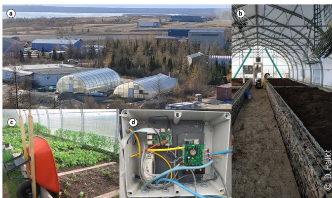
Serres de Kuujuaq (a), pour lequel un système de stockage innovant a été mis en place (b) afin d'allonger la saison de culture (c). Un suivi des performances du système est permis grâce à une instrumentation spécifique développée dans le cadre du projet (d)